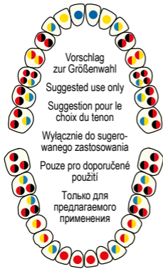
Abb 1 / Fig. 1/ Schéma n°1/ rys 1/ obr 1/ рис 1